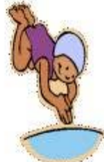
Activités Sportives et de Loisirs Activités Extérieures